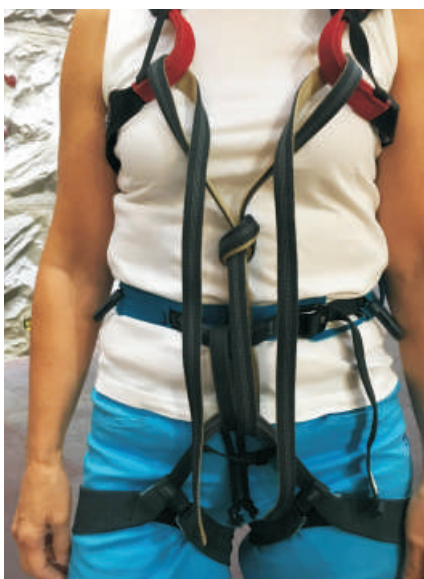
4. Protažení popruhu navazovacími oky hrudního úvazku.