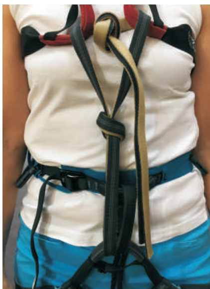
5. Uvázání dalšího vůdcovského uzlu na popruhu nad hrudním úvazkem.