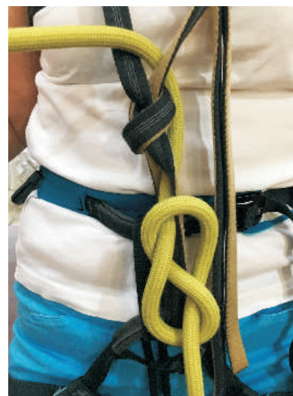
6. Protažení lana s osmičkovým uzlem plochou smyčkou.

Navázání na sedací a hrudní úvazek pomocí smyčky (Alpský způsob)