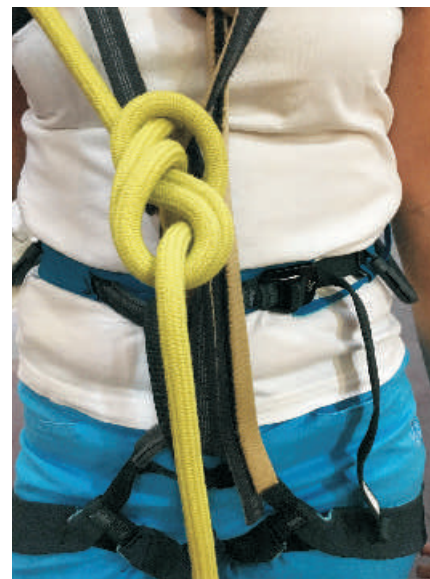
9. Uvázání osmičkového uzlu.