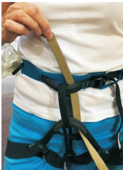
2. Protažení popruhu sedacím úvazkem.