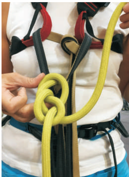
8. Uvázání osmičkového uzlu.