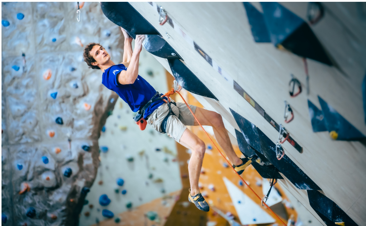
Adam ve finálové cestě MČR

O víkendu 16.-17. 10. proběhly na HUDY stěně v Brně hned dva mistrovské závody 2021. V obtížnosti závodili mladí lezci kategorií U14 a v lezení na rychlost pak mládežníci i dospělí. První den se na MČR U14 v lezení na obtížnost sešlo 89 malých závodníků, aby se "poprali" o tituly mistrů na parádních cestách od stavěčského tria ve složení Viktor Pařízek, Michal Kalvas a Olina Stehlíková. Druhý den pak proběhlo Mezinárodní mistrovství České republiky dospělých, Mistrovství České republiky mládeže a Mistrovství České republiky U14 v lezení na rychlost. Závodů se zúčastnilo 73 závodníků, z toho 49 závodníků v kategorii U14 a 24 závodníků v kategorii mládeže a dospělých.