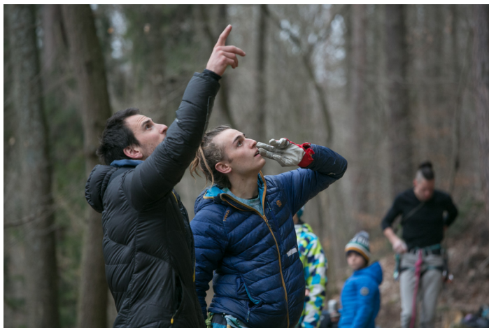
Nábor Sokolíků

Během následujících tří let absolvuje osmičlenné družstvo pod vedením zkušených (horo)lezců řadu výjezdů do skal a hor nejen v Česku ale i v zahraničí.