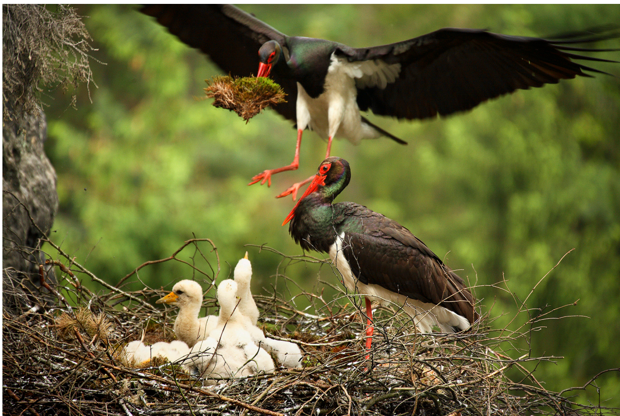
Autor: Václav Sojka

Upozorňujeme na uzavírky skal z důvodu hnízdění ptactva, zejména sokola stěhovavého, výra velkého a čápa černého. Průběžně aktualizované informace naleznete na našem webu www.horosvaz.cz a v databázi Skály ČR. V řadě oblastí platí každoroční časová omezení. Upozorňujeme hlavně na Český ráj, v Adršpašsko – teplické skály, Broumovské stěny a další oblasti Broumovska, pravý břeh Labe, oblasti Moravského krasu, Pálavu atd. Dále mohou být vyhlášeny také dočasné uzavírky.