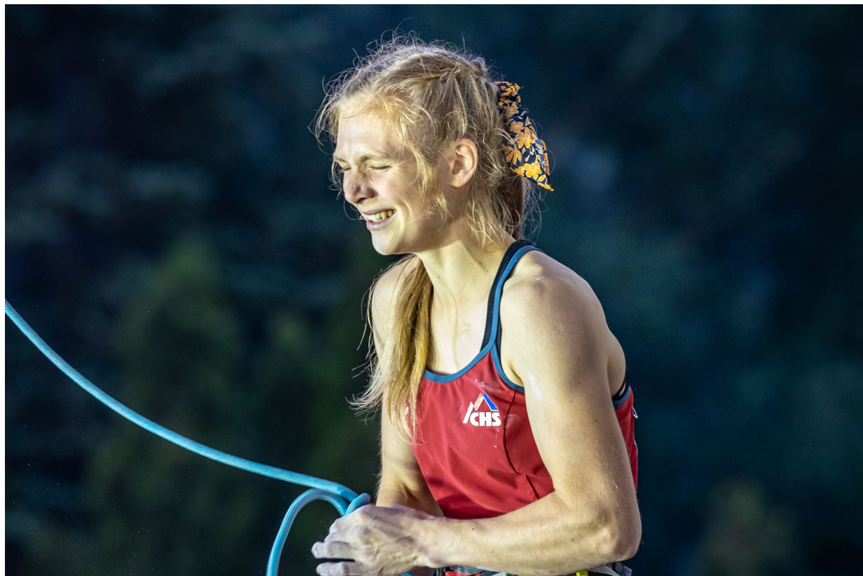
Autor: Jan Virt, Eliška po finálové cestě na SP Briancon