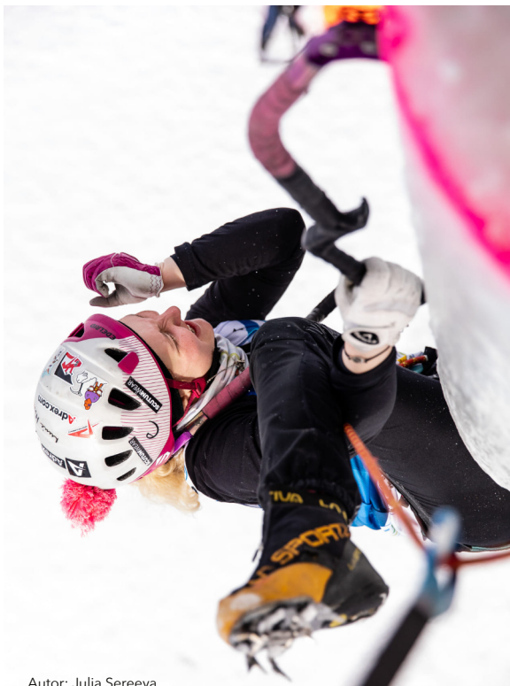
Autor: Julia Sereeva