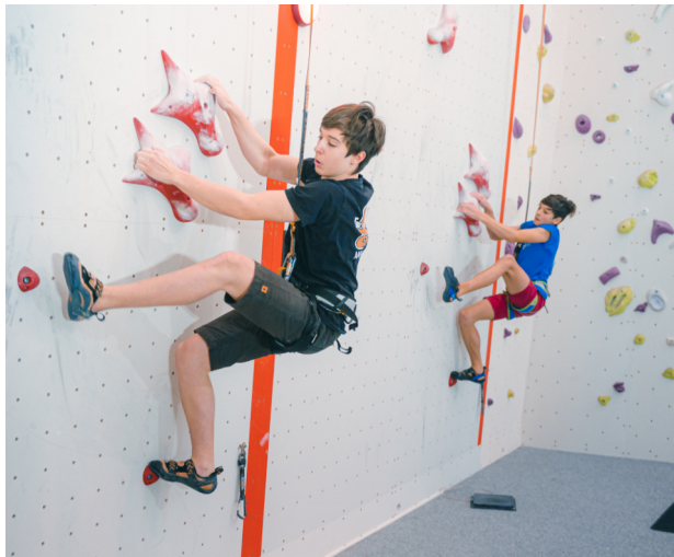
Autor: Petr Chodura