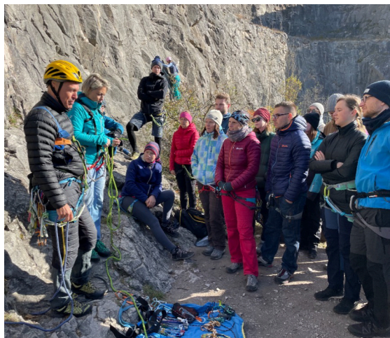
Foto: Metodický den ČHS, Srbsko

V průběhu posledního čtvrtletí se podařilo dokončit instruktorské kurzy CWI (instruktor lezení na umělé stěně) a SCI (instruktor sportovního lezení), jejichž průběh zpomalily covidové restrikce. Dokončen byl také kurz Trenér B a došlo k otevření kurzu Trenér C .