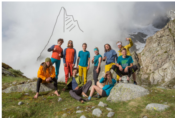
nová parta Sokolíků