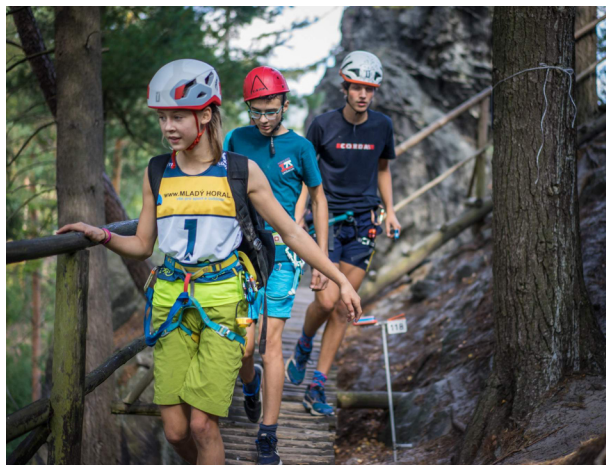
Mladí horalové na Malé skále

Jednou z nejvýznamějších mládežnických akcí ČHS je outdoorová soutěž Mladí horalové. Čtyřčlená družstva z lezeckých oddílů zapojených do Sítě mládežnických klubů porovnávají své nejen lezecké schopnosti nejprve v rámci oddílového kola a ti nejlepší následně v rámci celoostátního finálového závodu. Přihlášky se podávaly do konce června a finále proběhne 18. 9. v Babím lomu. Organizátory jsou pro tento rok HK Babí lom Kuřim a Ležčata