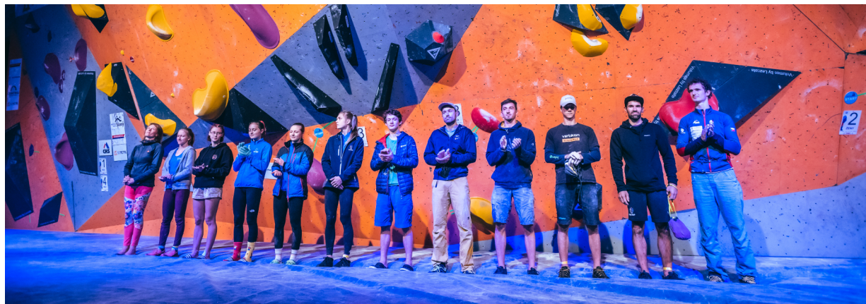
Autor: Petr Chodura, finalisté MČR