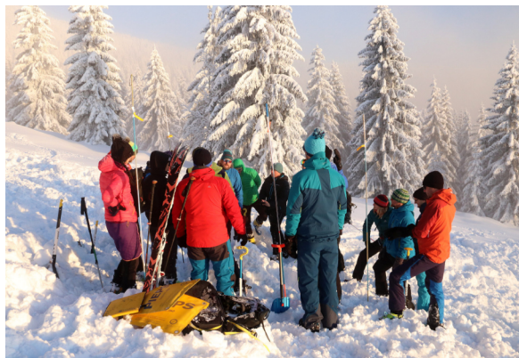
Foto: Workshop Lavinové problematiky na Setkání skialpinistů