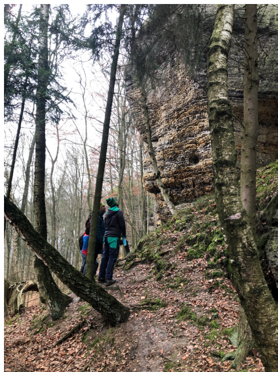
Foto: Obhlídka terénu, Mladí horalové 2022

V neděli 28. 11. začaly přípravy dalšího ročníku soutěže Mladí horalové. V Kokořínském dole se setkali zástupci Komise mládeže ČHS se zástupci pořadatelských horolezeckých spolků HO Satalice a LK Mšeno, aby společně vyrazili na první obhlídku skalních terénů a následně diskutovali možné varianty závodní trasy a případné vytvoření dvou různých závodních okruhů.