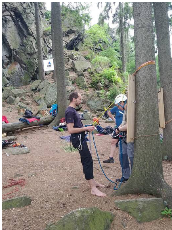
Metodický den na Drátníku

První vzdělávací akce a kurzy proběhly kvůli covidu až koncem května a začátkem června. Na konci května proběhl doškolovací kurz na Rabštejně, zaměřený na postupy při výuce nováčků, přihlášeno bylo 8 zájemců, z nichž 7 úspěšně prošlo kurzem a 1 se nedostavil. Začátkem června proběhl další doškolovací kurz, tentokrát na téma jak připravit děti na lezení v horách, kterého se zúčastnilo 13 osob. Dále se konal lezecký metodický den na Drátníku, kterého se zúčastnilo 16 osob.