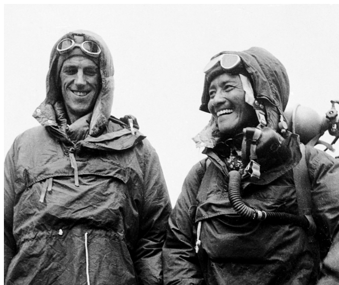
Edmund Hillary a Tenzing Norgay

Jak šel čas, himalájské vrcholy byly stále dostupnější. Technický pokrok znamenal propracovanější vybavení a kvalitnější přípravu, uvolnění pravidel pak znamenalo snadnější získání povolení k výstupu. Každoročně se zvyšoval počet pokusů o výstup a s tím se také počet obětí. Ovšem, než na nejvyšším vrcholu světa poprvé zavlála československá vlajka, uplynulo dalších 31 let.