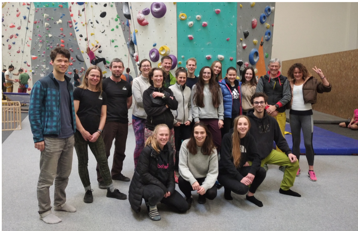
Foto: Absolventi kurzu Trenér sportovního lezení C1

Máme velkou radost, že se nám v roce 2022 podařilo aktualizovat metodické karty, které nyní mohou využít všichni členové ČHS a zájemci o rozšíření znalostí v oblasti metodiky lezení. Karty naleznete na webu ČHS .