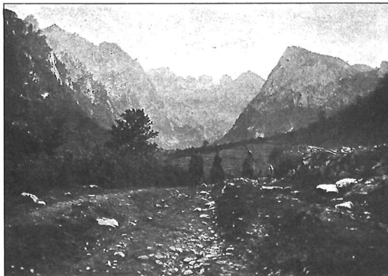
ZÁVĚR ÚDOLÍ GRBAJ V PROKLETJI.

Po 5. hodině večerní přijel pohřební vůz s rakví z Lublaně. Za