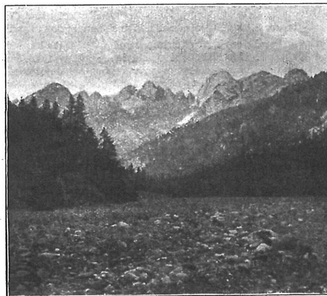
Ke článku Skupina Višská.