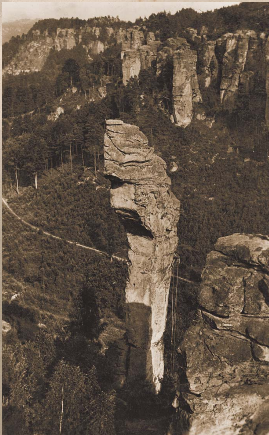
Výstup Německou cestou