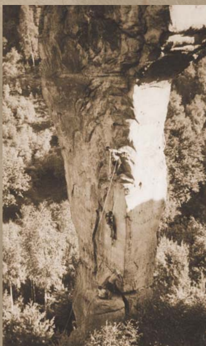
Trojice českých lezců na cestě za svým snem v roce 1939

To se psal rok 1937. Za pár dnů jsme šli s Fífanem na vojnu, každý jinam. S lezením byl na dlouho konec. Co čert nechtěl, jednou jsem se