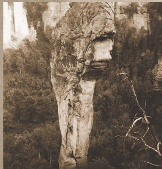
Prvovýstup Českou cestou, 1939