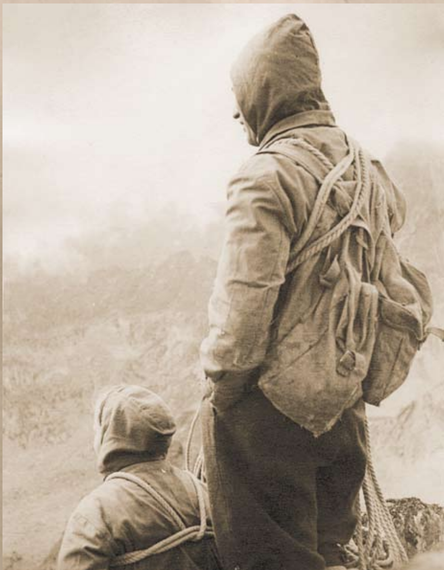
Galerka v šestačtyřicátém byla vylezena s takovouto výbavou...

Vstupujeme do komína, ale o komínové technice zde nemůže být ani řeč! Leze se po vnitřní stěně komínu, z obou stran zastíněné jeho mohutnými žebry. A pomalu již přibývá na obtí-