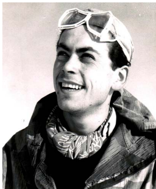
1951 – Vysoké Tatry