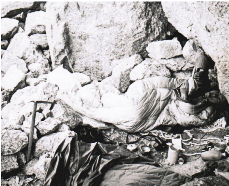
V bivaku na Petit Dru