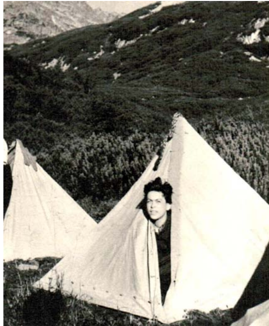
1951 – při táboření ve Vysokých Tatrách