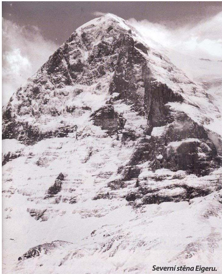
Severní stěna Eigeru.