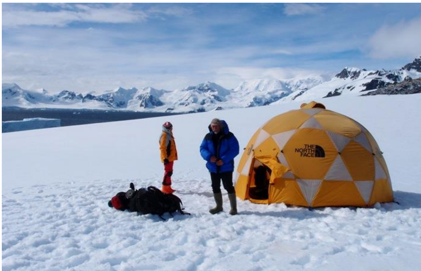
Domeček a v něm stoleček...