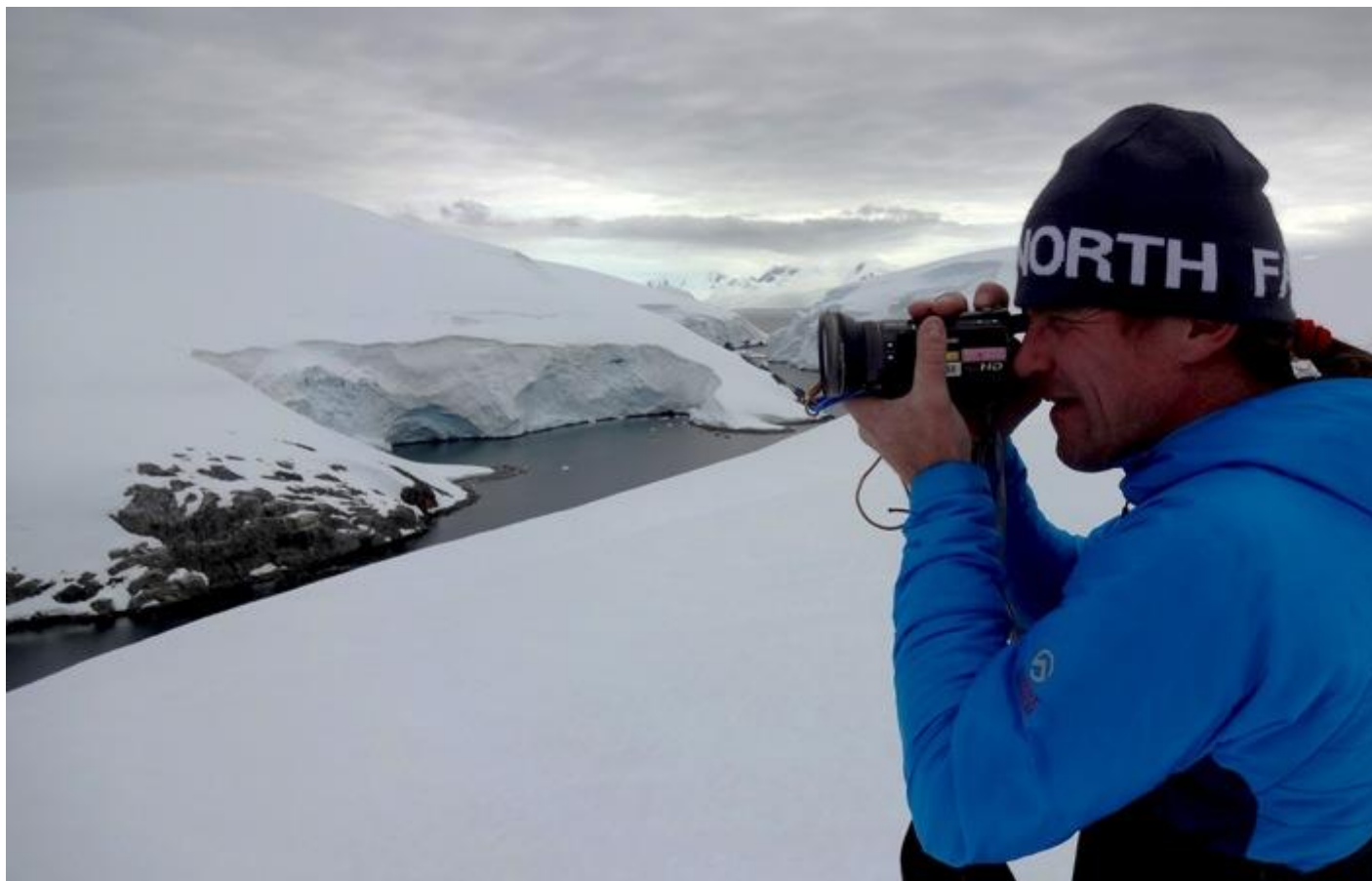
Záznam pohyblivých obrázků a já v akci.