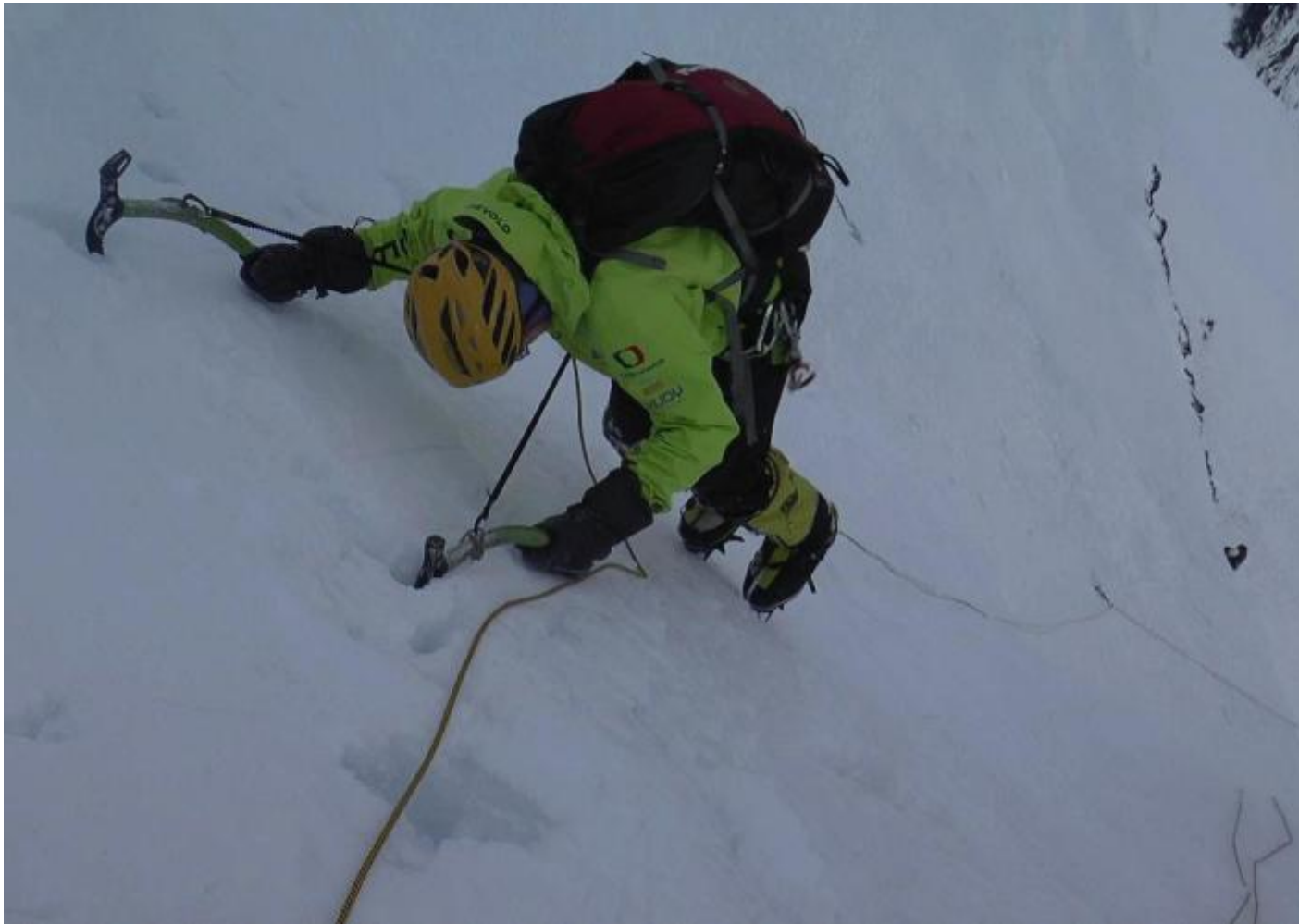
Lezení v horních partiích. (Fotografie z filmového záznamu.)