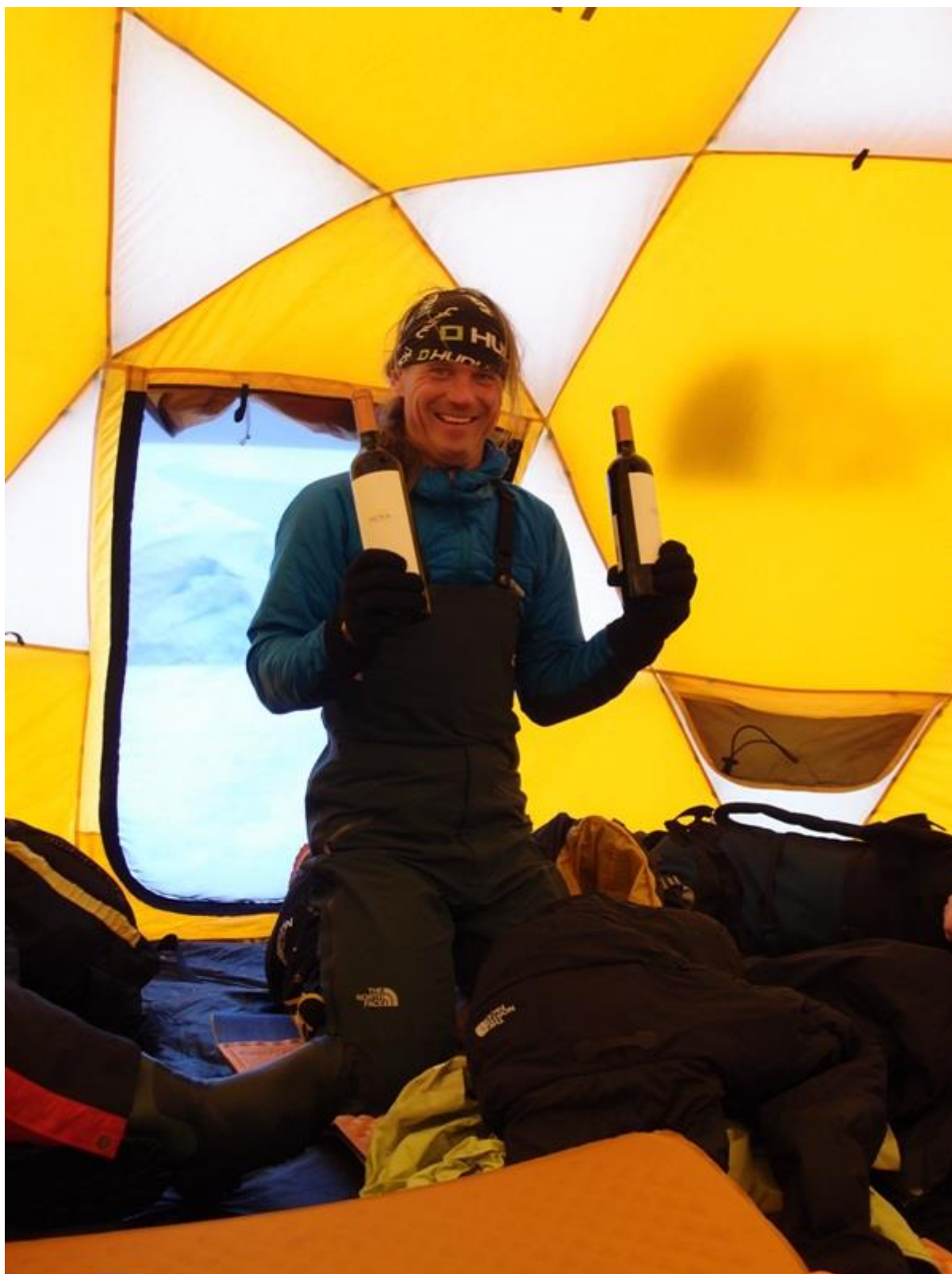
A nebo místo stolečku, dobré Argentinské víno.