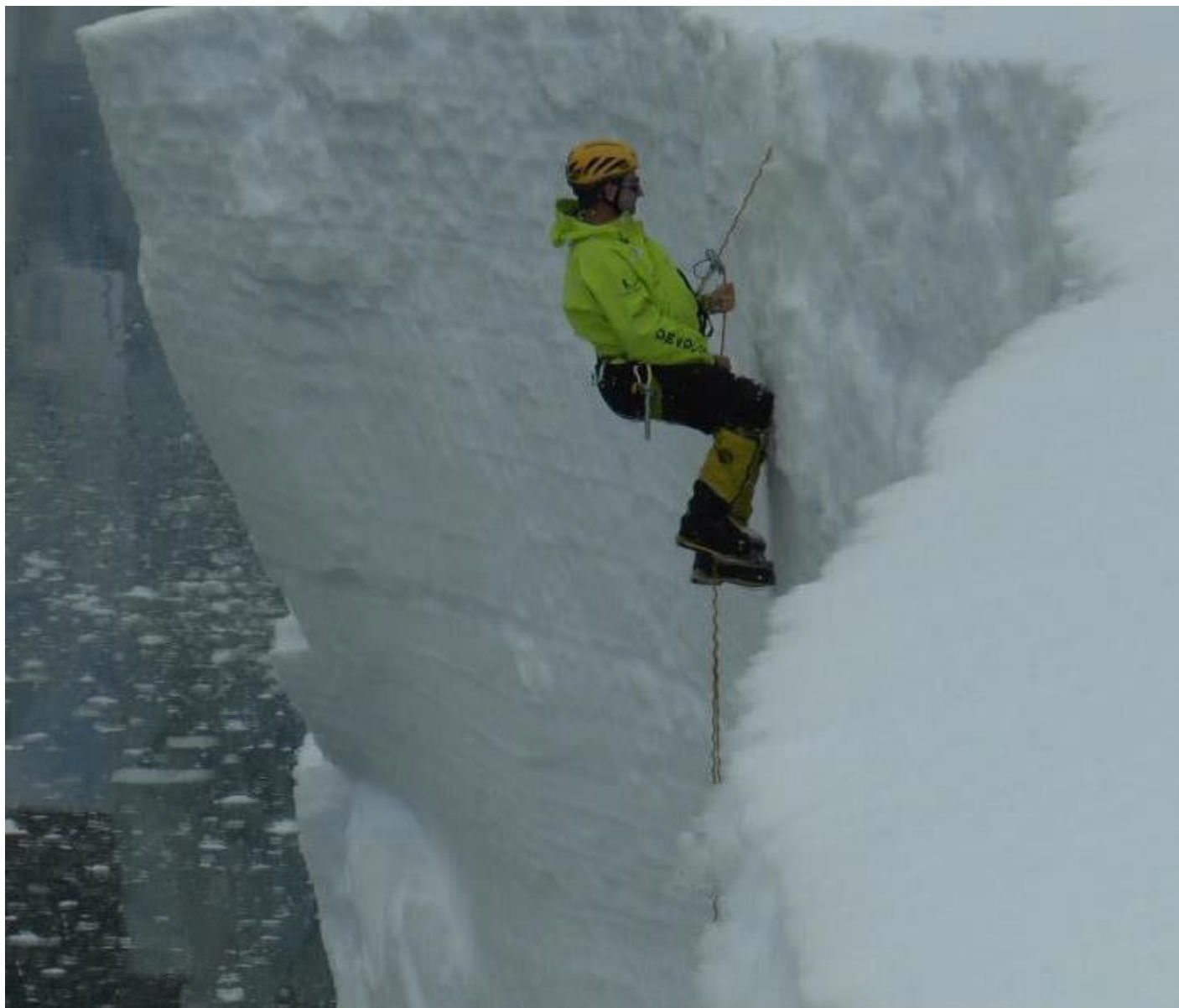
Slanění na loď. (Fotografie z filmového záznamu.)