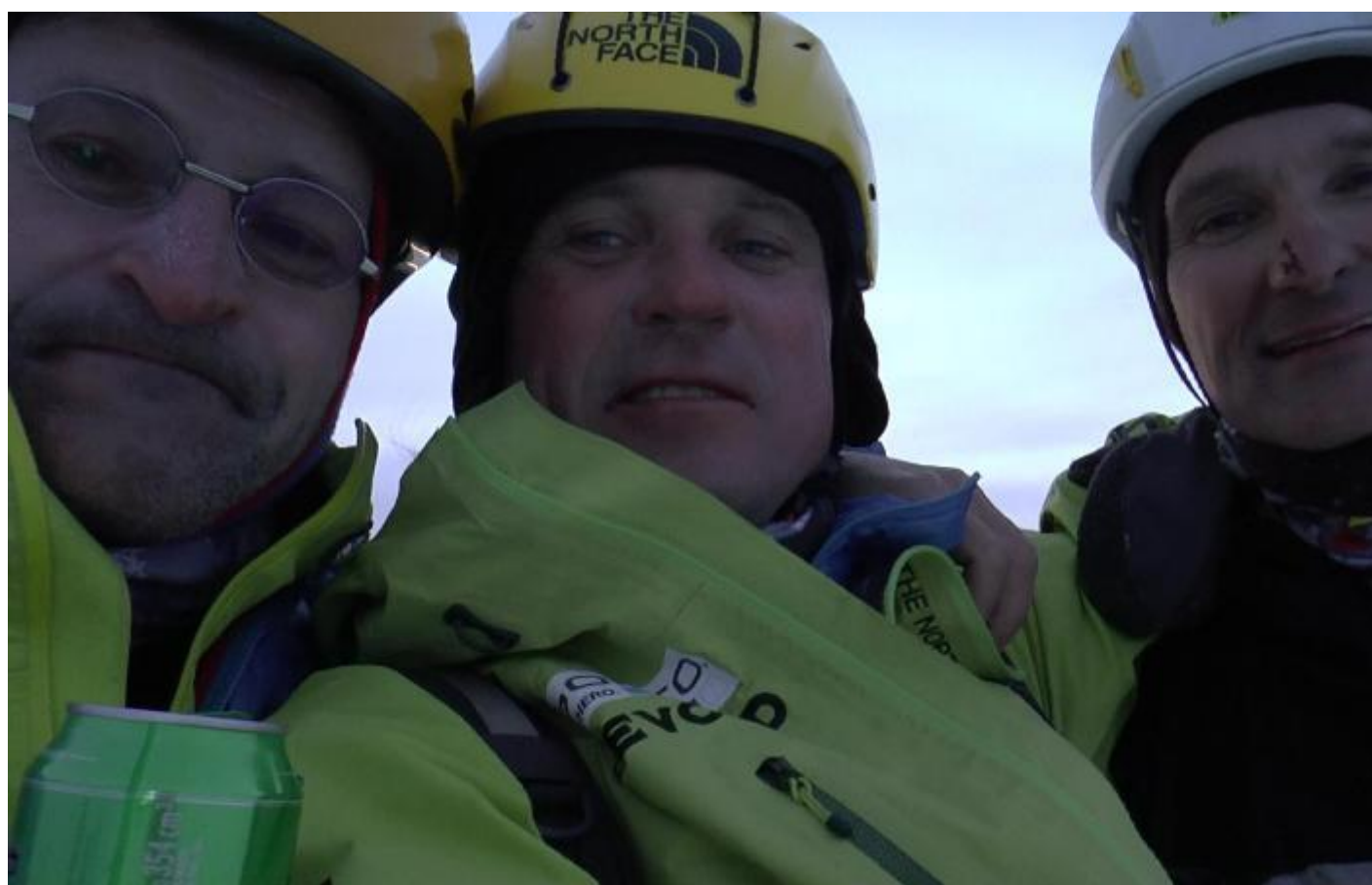
Vršek Monte Samily ve dvě hodiny ráno. (Fotografie z filmového záznamu.)