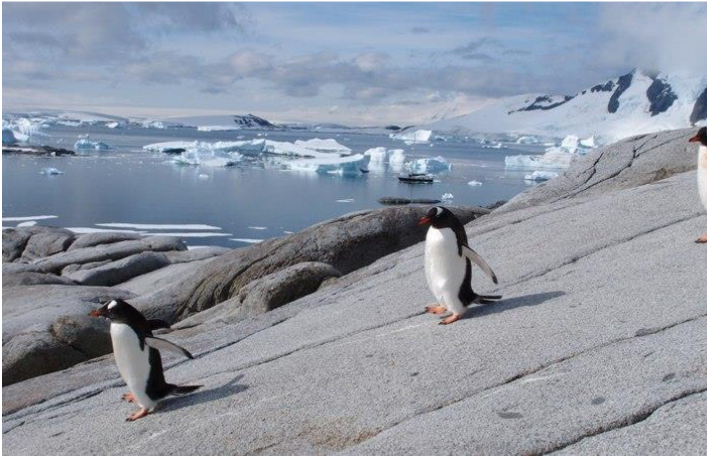
Kluci "Tučňáci" v akci.