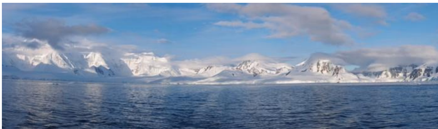
Krajina svatého klidu.