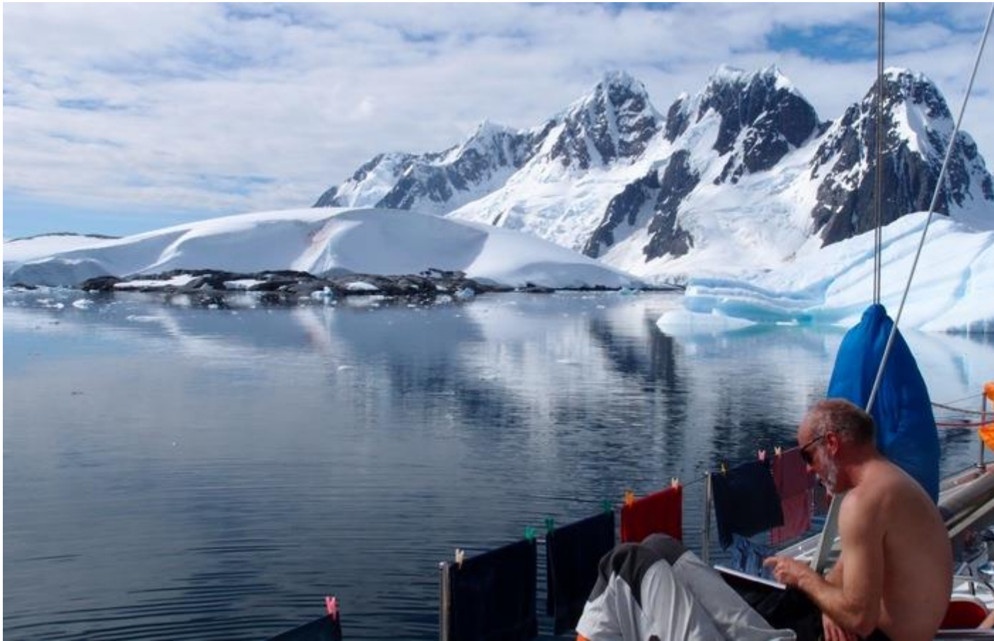
Pak že je Antarktida ledničkou země.