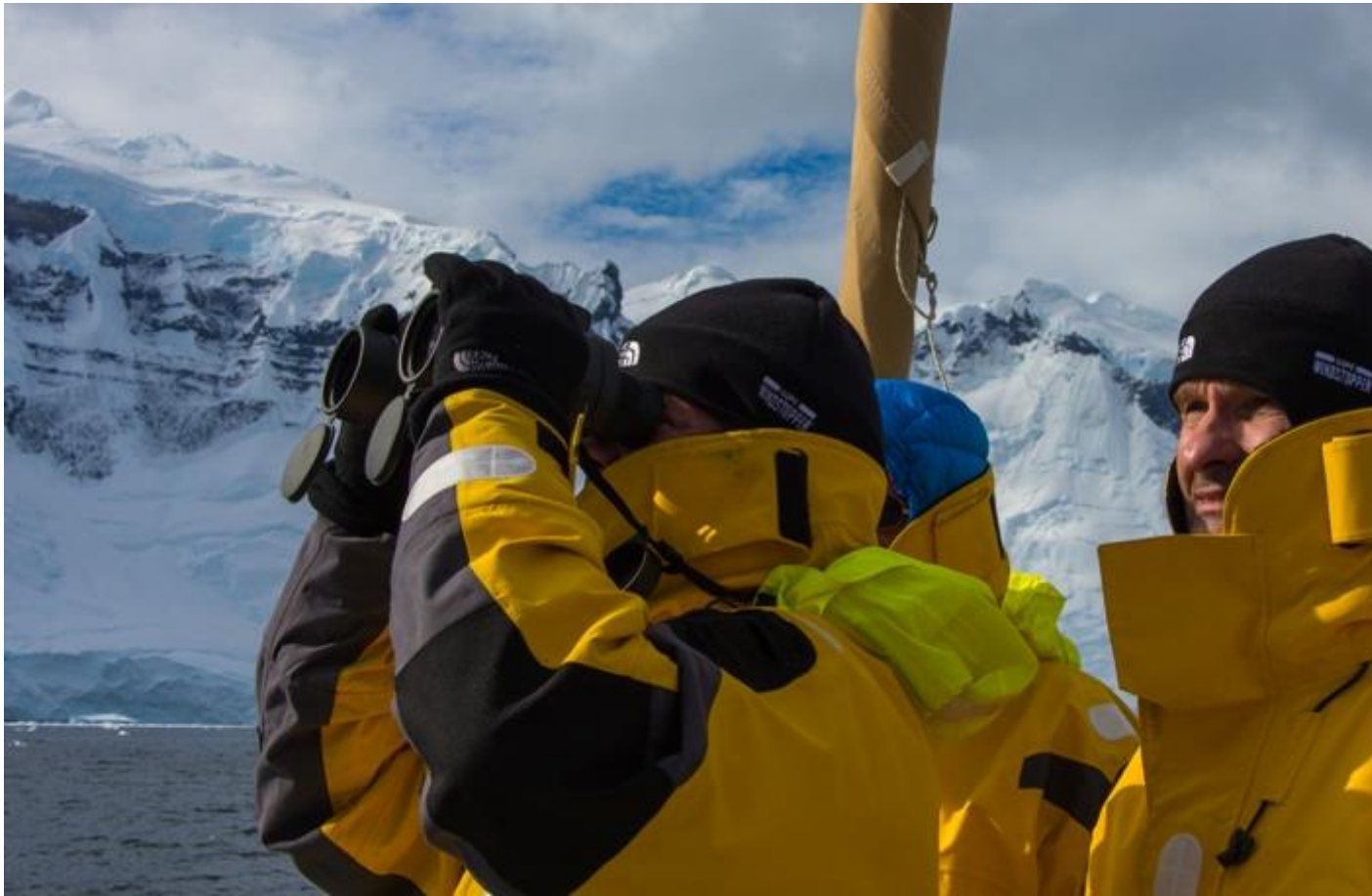
Hledání nové linie. Kde jen může být?