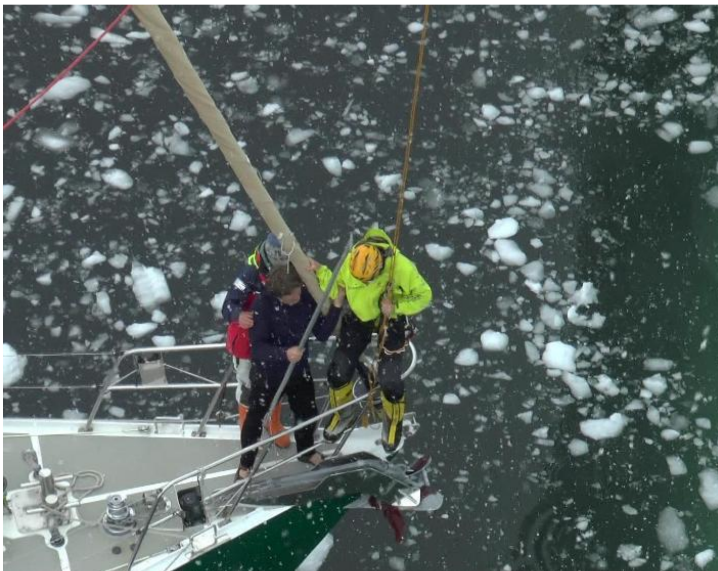
Dosednutí na palubu. (Fotografie z filmového záznamu.)