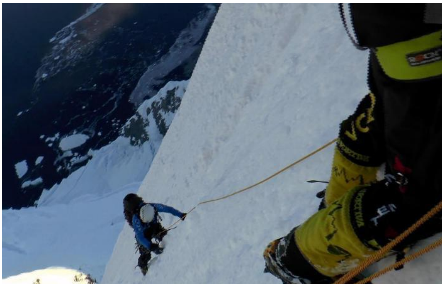
Sněhové varhany. (Fotografie z filmového záznamu.)