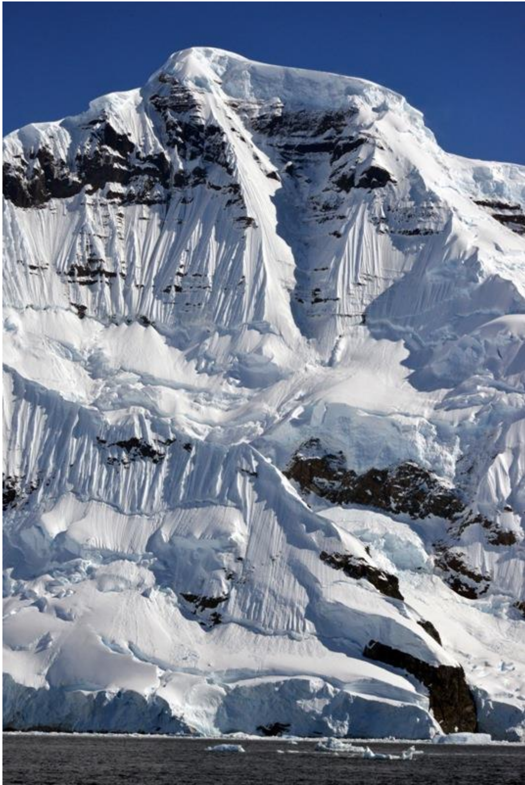
Krásná JZ stěna Monte Samily.