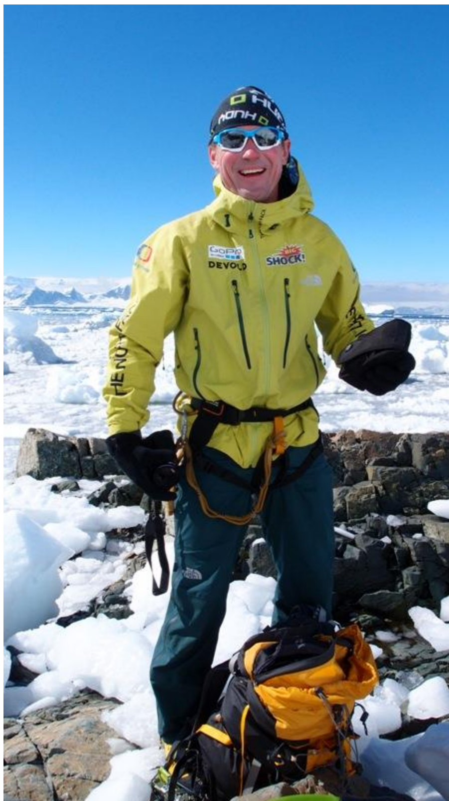
Radost nic netušícího. Těsně před nástupem do stěny.