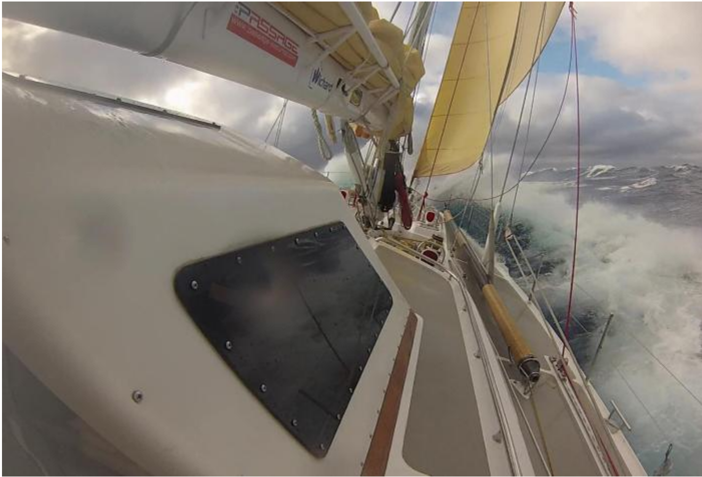
Radůstky na Drakeově průlivu.