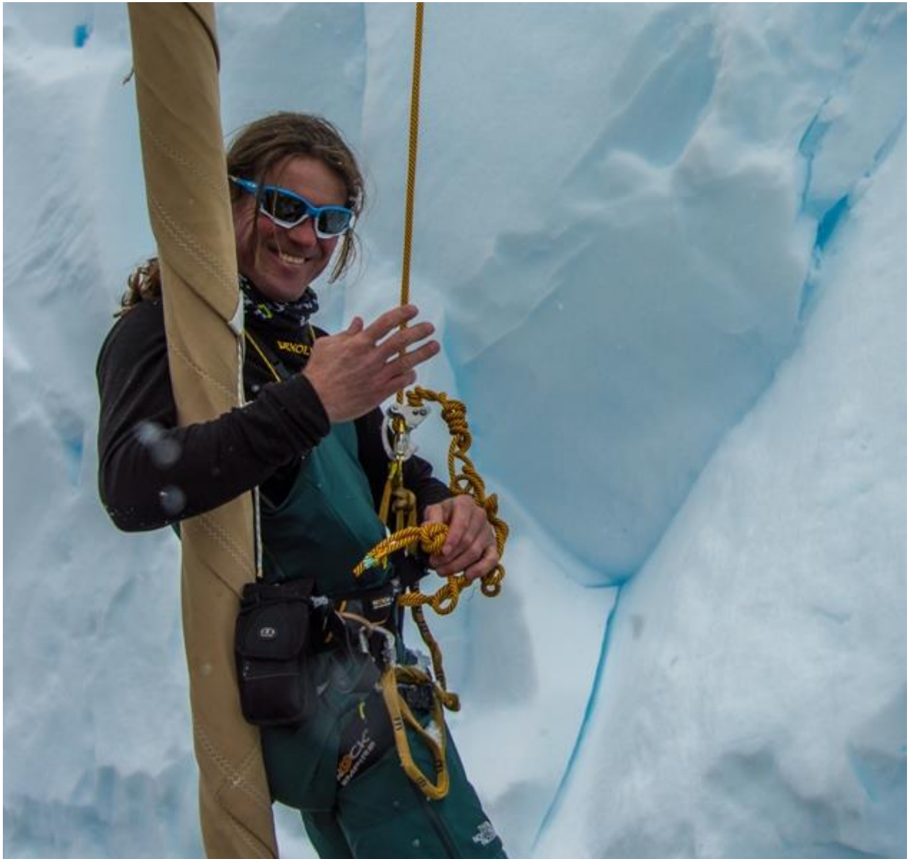
Také to už mám za sebou.