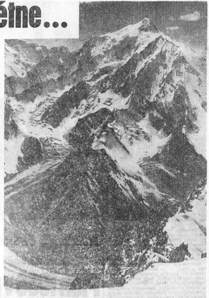
Pohled na zaledněný masiv Kúht Hewad (Ottina), nejvyšší v Išmurské oblasti.