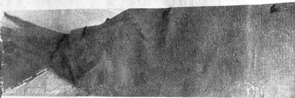
Grandes Jorasses pri pohľade z