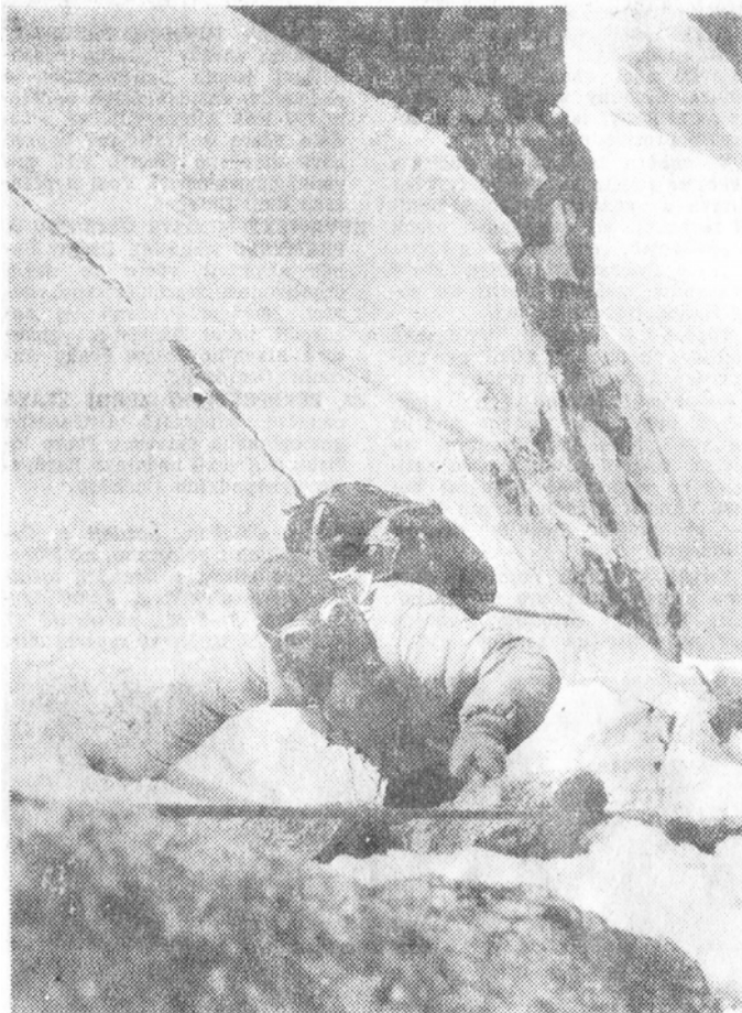
Ve strmé stěně Uparisiny