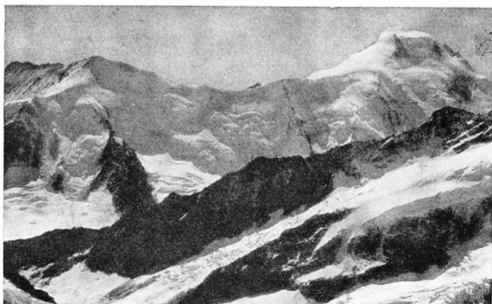
Aletschský ľadovec zo sedla Mnícha