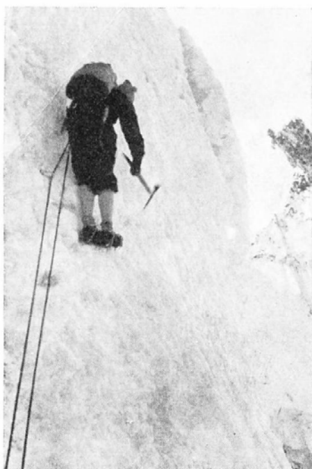
V severnej stene Mnícha

darovanej chate Mitteleggi. Výstup trval dlhšie, ako sme čakali. Slnko už zapadá a stále ešte nemrzne. Ak sa neochladí, nebudeme môcť zajtra pokračovať vo výstupe na Eiger. Zo snehových polí padajú lavíny. Dúfame, že do rána spadne aj v žľabe, ktorým chceme zostúpiť.