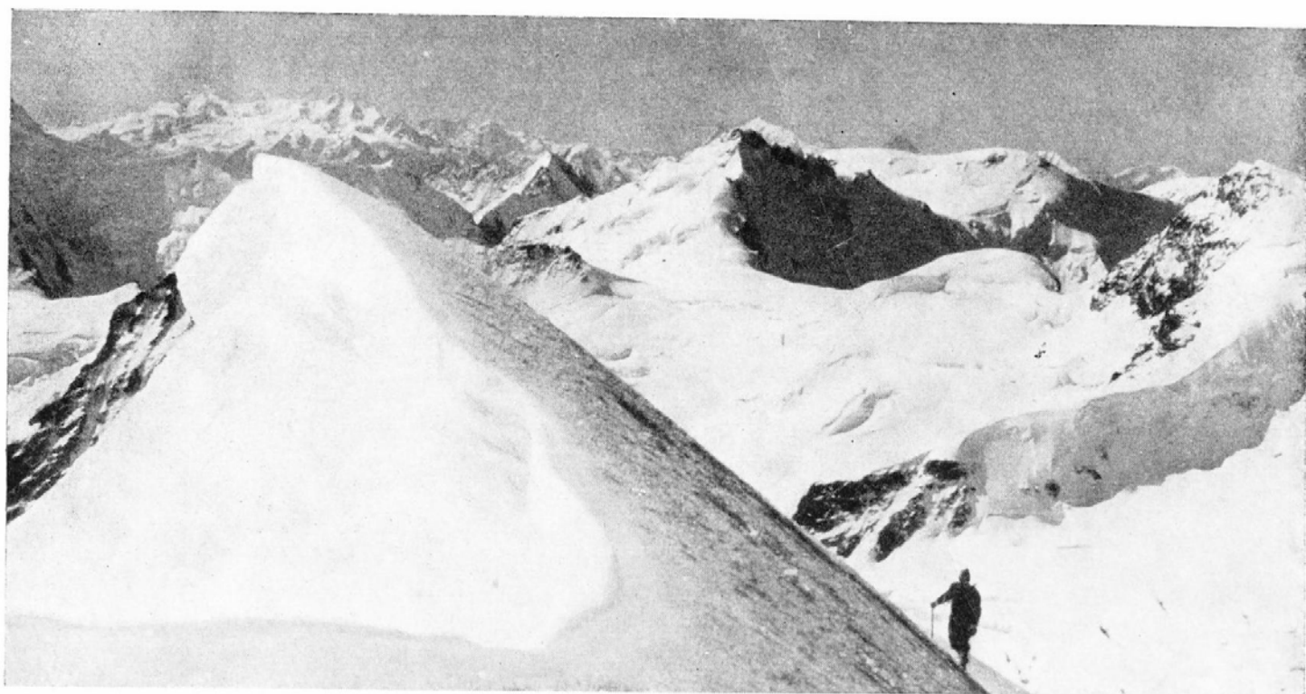
Walliské Alpy z Mnícha