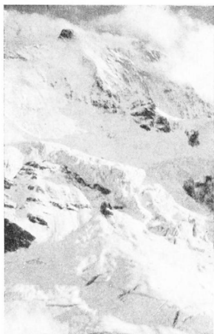
Jungfrau. 4167 m. Severná stena