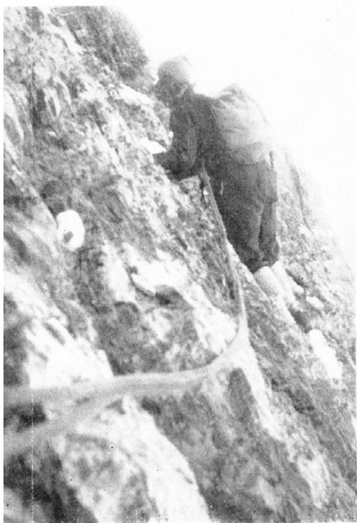
Hinterstoisserov traverz Po druhom bivuaku (na snímke R. Kuchař) Traverz Bohov (na snímke Zd. Zibrin)