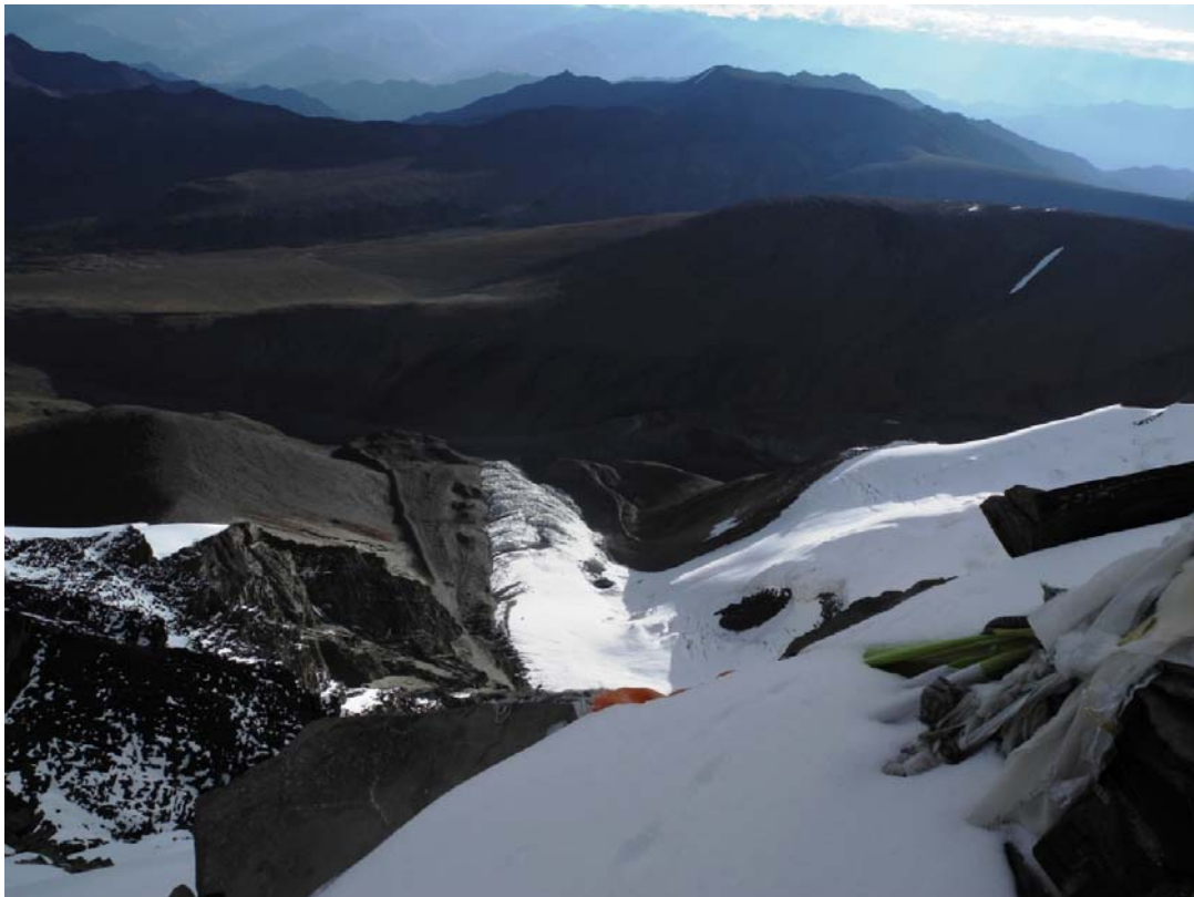
Západní cesta – pohled z vrcholu