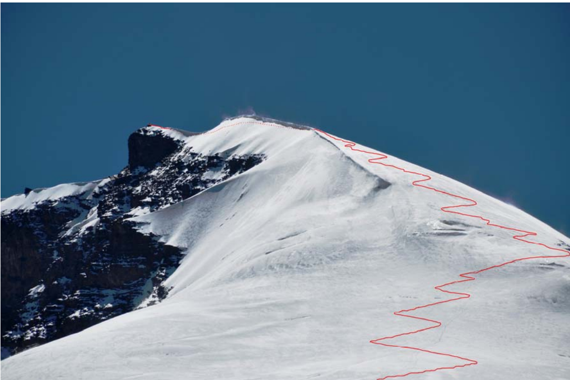
Vrcholový hřeben a vrchol Kang Yatze II (6.250m)