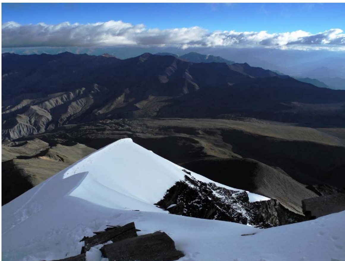
Pohled z vrcholu jihozápadním směrem