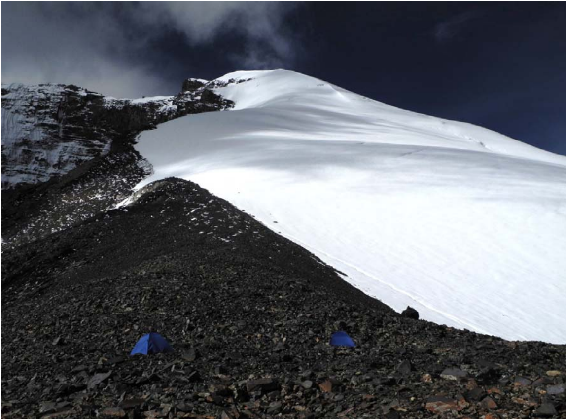
Kang Yatze – výškový tábor (5.500m)