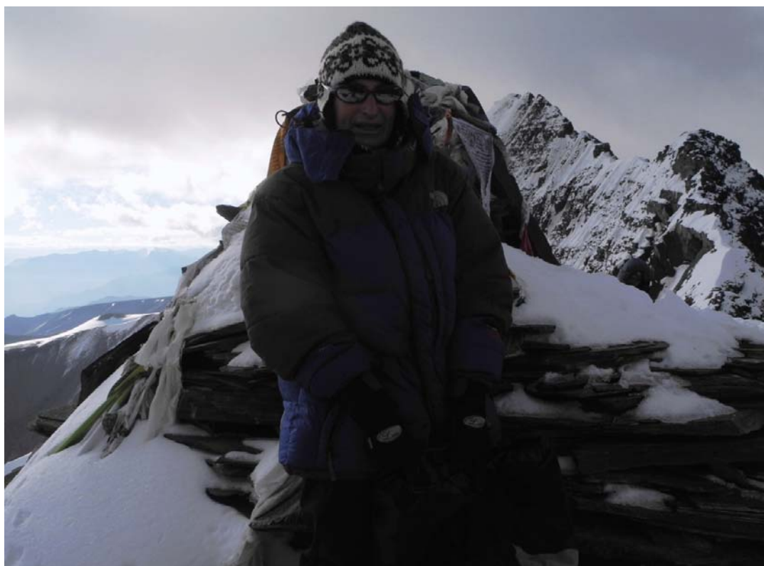
Kang Yatze II – vrchol (6.250m)