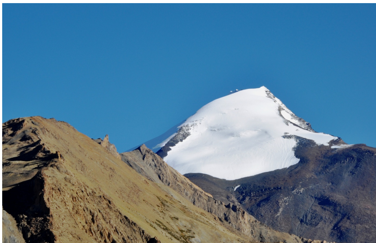
Kang Yatze z cesty do údolí řeky Markha, pohled na západní cestu