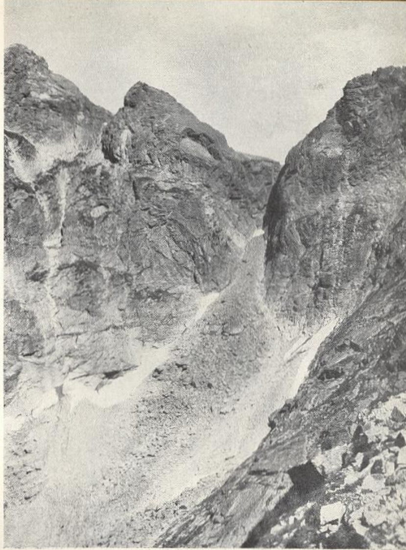
Zabí Kôň, južná stena.