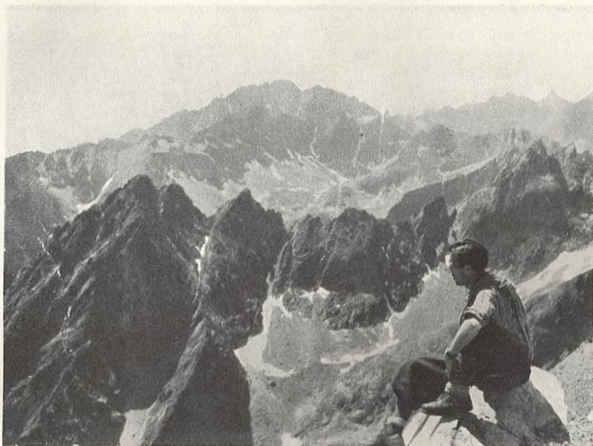
Stalinov štít — Stredohrot — Zltá veža — Priečna veža — Široká veža.