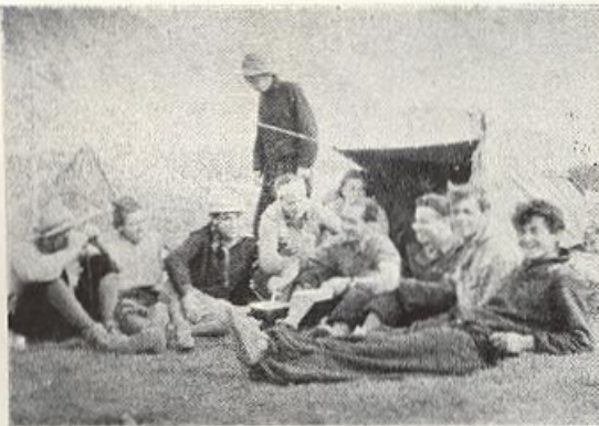
V stanovom tábore pred večerou.