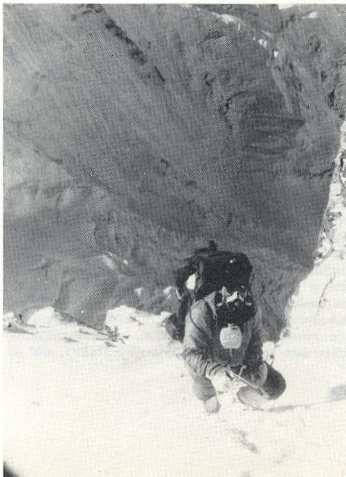
Lezenie vo výškach asi 8000 metrov