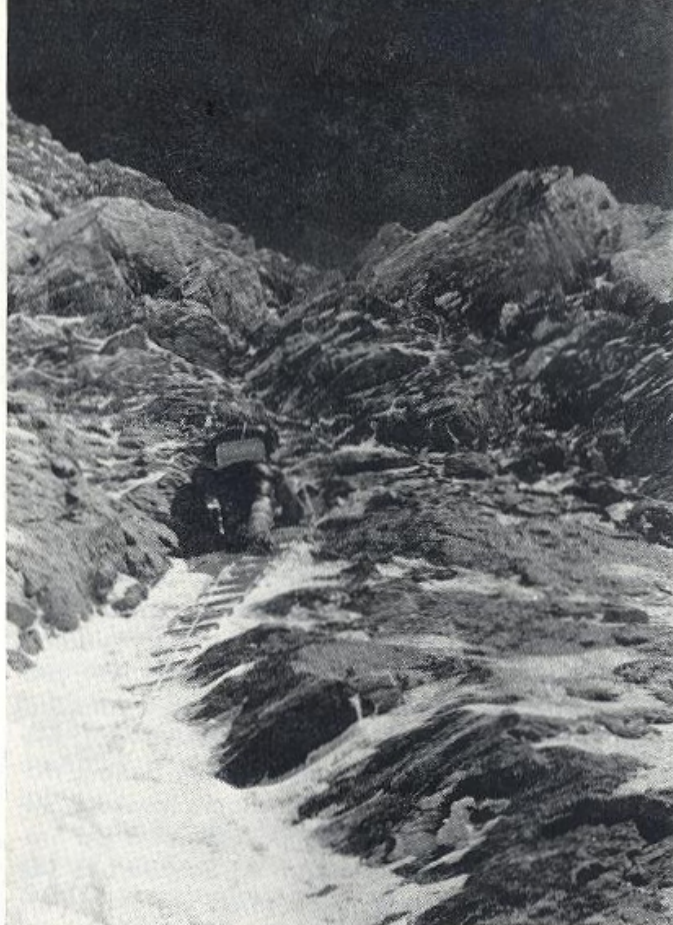
Pod IV. táborom vo výške 7000 metrov