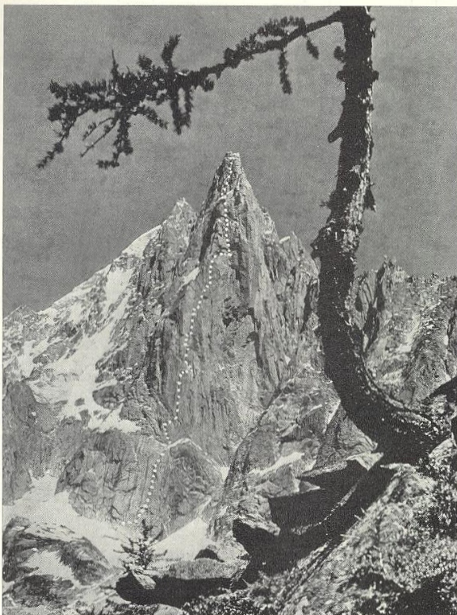
Západná stena Petit Dru s vyznačenou trasou výstupu