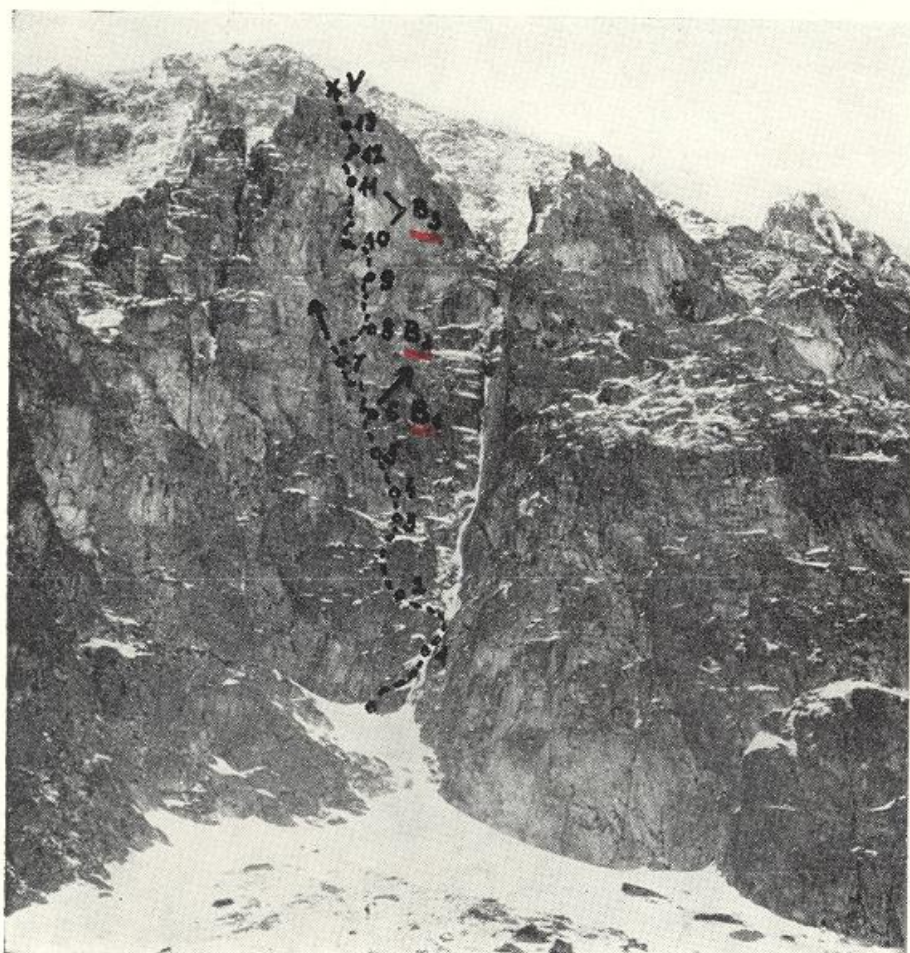
Malý kežmarský štít, Severná stena. (1, 2, 3 — stanovištia, B 1 , B 2 , B 3 — bivaky, → varianty.)