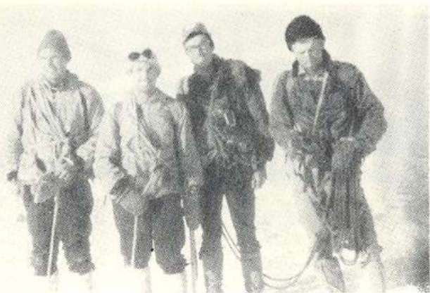
S priateľmi z piliera

Mlčky stojíme na vrchole. Naše pohľady smerujú na východ. Tam niekde sme snivali a pripravovali sa na túto našu veľkú túru.