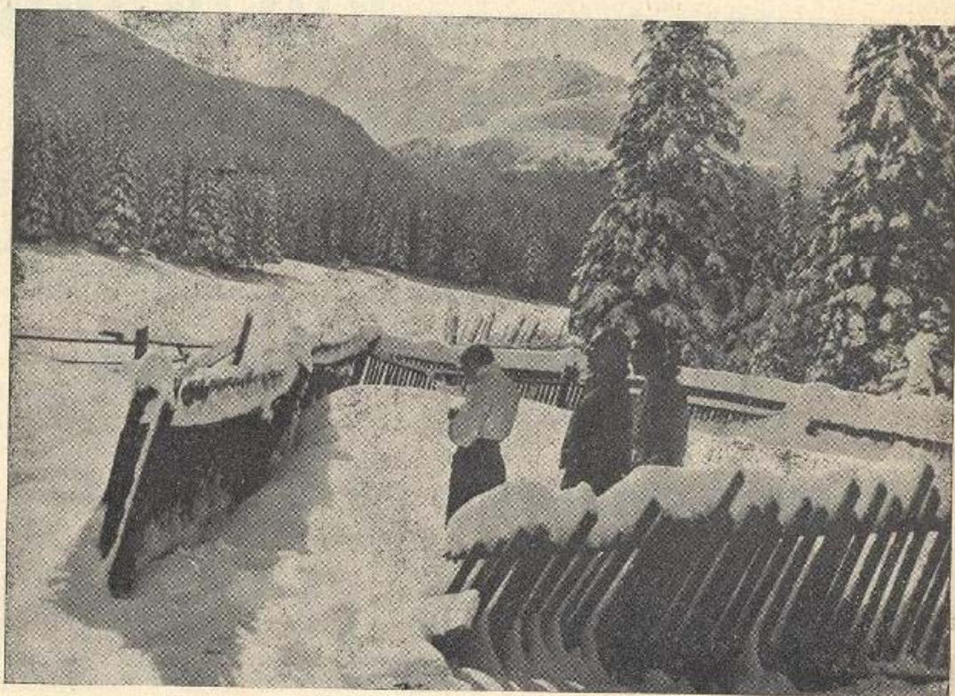
Vysoké Tatry: Kolový a L'adový štít od Galajdovky. Les Tatry: Les sommets de Kolový et L'adový vus de la Galajdovka.

Přednáškové turné dra Jeana Arlauda o první francouzské výpravě do Himalají 1936. Přednáška v Hradci Králové 3. května — v Praze 4. května — v Plzni 5. května — v Brně 7. května — v Bratislavě 10. května 1937. Pro celou československou veřejnost, ale naše členy především!