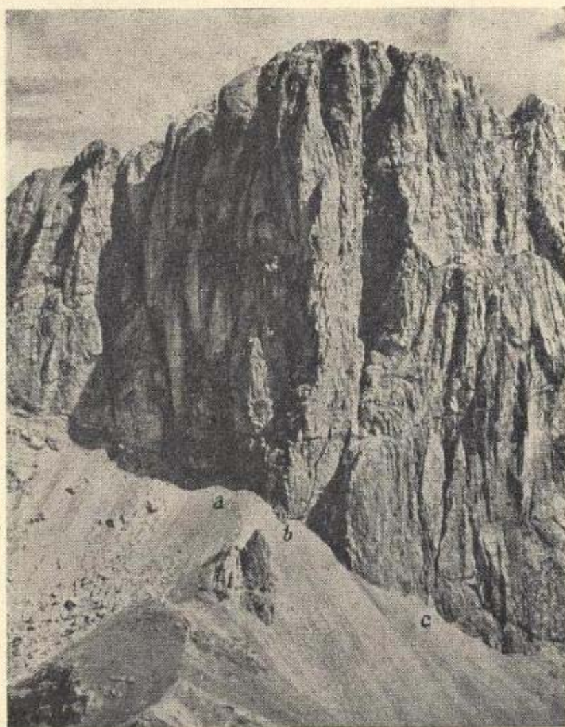
Stěny Marmolaty, a) jihozápadní stěna, b) jižní pilíř, c) jižní stěna - Les parois de Marmolada, a) la paroi SO, b) le pilier de Sud, c) la paroi de Sud.

Mezi novými výstupy v Dolomitech stojí na prvním místě výkon horolezců italských G. Solda a U. Conforto, kteří zdolali jihozáp. stěnu Marmolaty (di Penia; 3.344 m). Jižní pilíř dělí tuto asi 550 m vysokou stěnu od »staré« klasické jižní stěny Marmolaty. Výstup trval 3 dny, čisté lezení 36 hodin (asi 15 m stěny za hodinu). Bylo zatlučeno