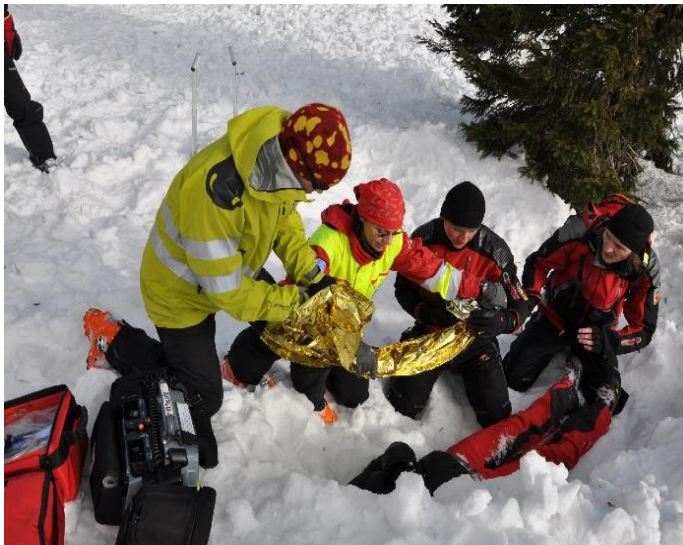
Foto z natáčení - Neodkladné stavy v horách | 8. - 9. 3. 2011 - Jeseníky Zdroj: Na hřišti i na vodě být s dětmi vždy v pohodě

Filmy byly představeny na Filmové noci FSpS , dne 12. 10. 2011. Český horolezecký svaz je uveden na stránkách projektu jako odborná spolupráce.