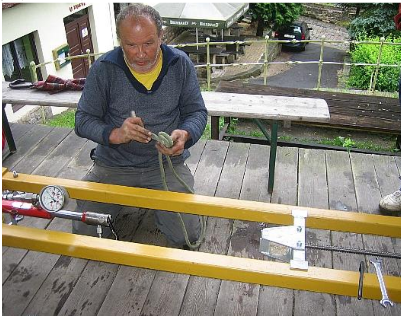
Příprava trhacího skřipce na smyčky..

Na závěr školení bylo podrobena právu útrpnému několik smyček stablek neznámého původu a stáří. Některé se natahovaly téměř donekonečna a né a né prasknout, jiné to vzdaly hned. Je to ošemetná záležitost – na pohled lze stěží odhadnout, co smyčka vydrží, proto je důležité uplatňovat princip preventivní opatrnosti a stabilky pokud možno nepoužívat (nedůvěřovat). Hlavně ty v hodinách jsou po čase nebezpečné.