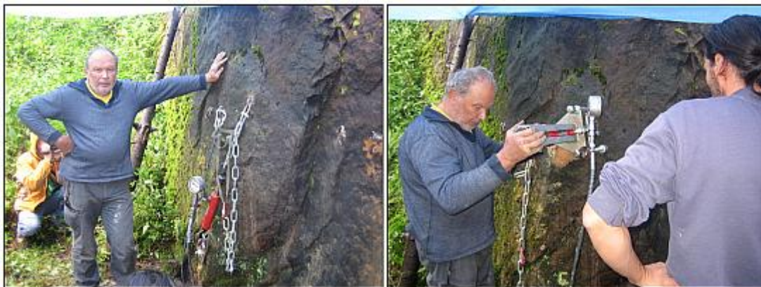
Trháme do všech stran..