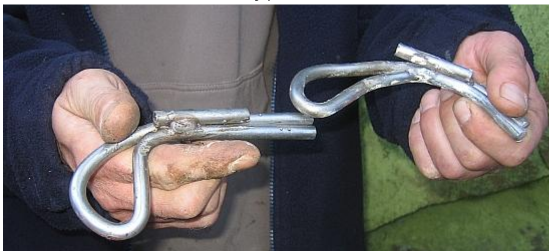
Tyhle krat'ouneké BH pochází z cest Lukáše Čermáka . Předsedovi OVK dělají vrásky na čele – takhle si bezpečné jištění nepředstavuje..