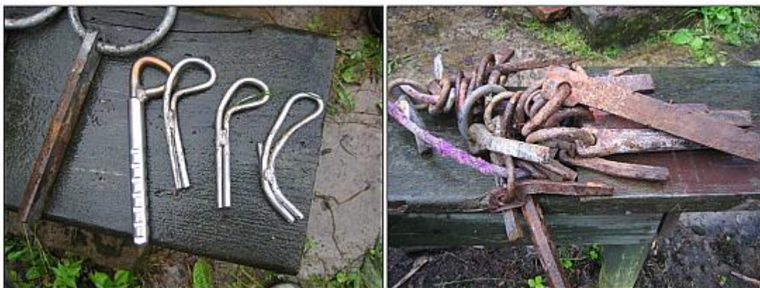
Včetně nejrůznějšího "šrotu" vytaženého při výměnách ze skal. První BH zleva je normovaný pro srovnání...