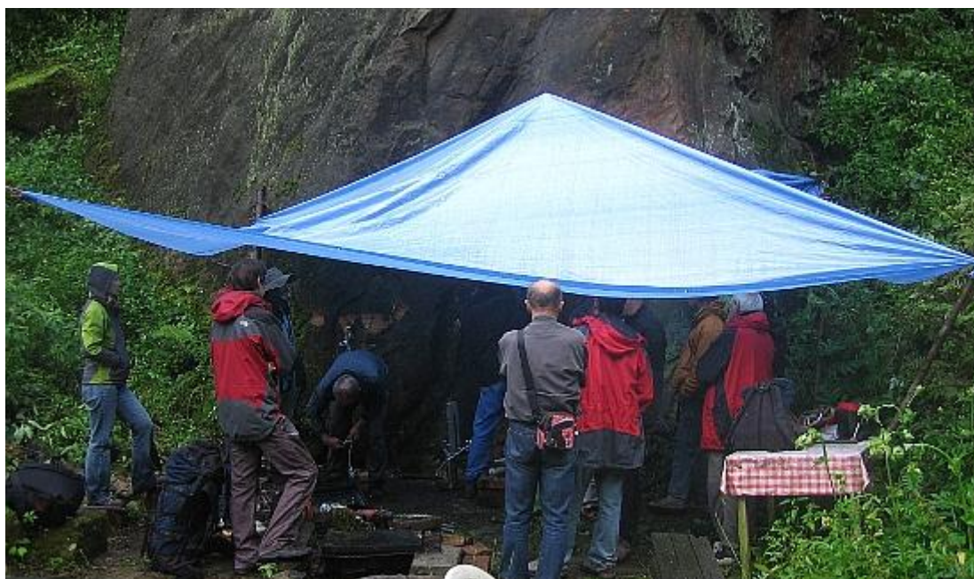
Celkový pohled na část zastřešené stěny, kde probíhaly trhací zkoušky BH a kruhů..