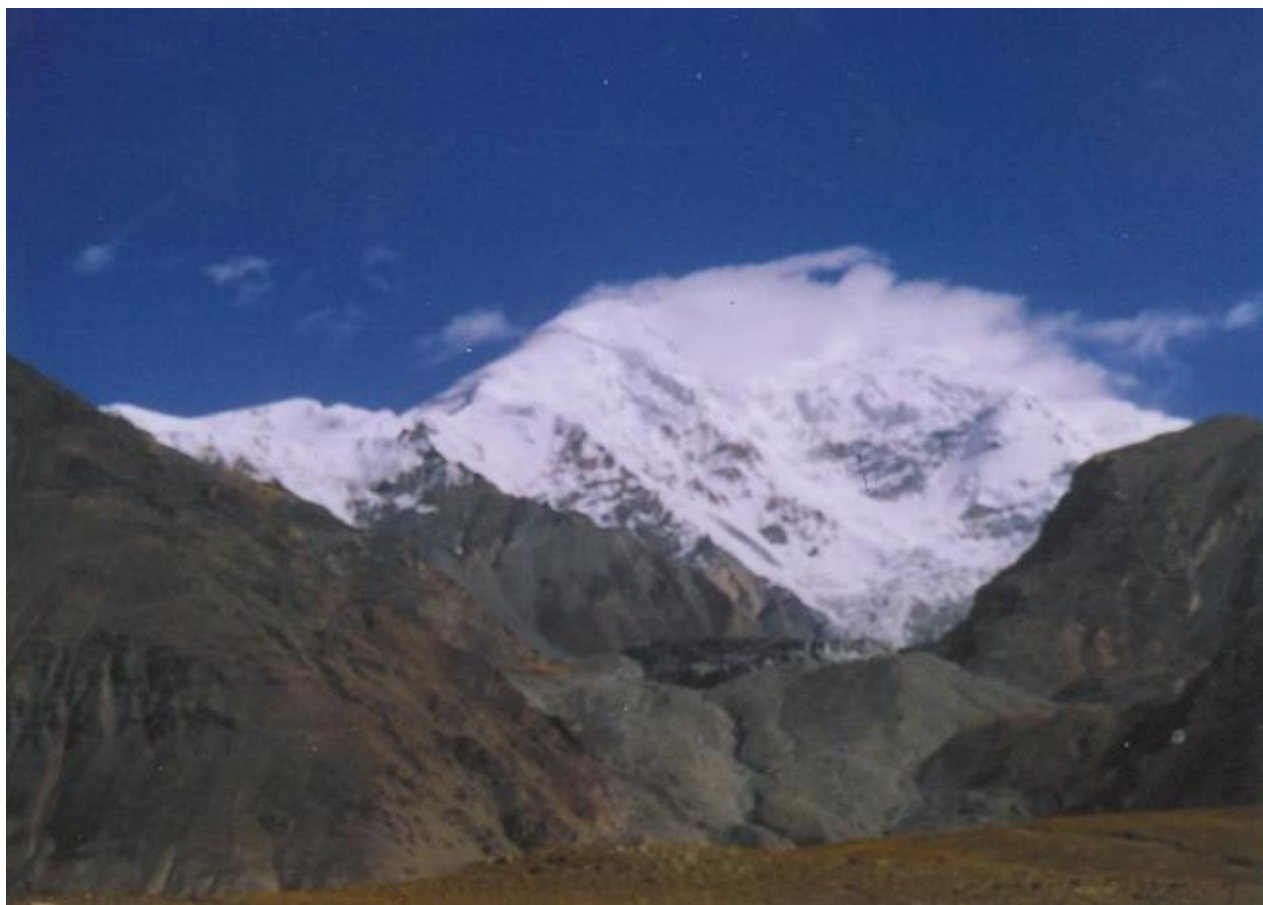
Kingata Tagh - jihozápadní stěna

Všichni účastníci mají bohaté zkušenosti se skialpinismem a zimním lezením a v případě příznivých povětrnostních podmínek a malého nebezpečí lavin je velmi vysoká pravděpodobnost dosažení několika prvovýstupů a prvosjezdů různého stupně obtížnosti.