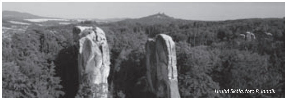
Hrubá Skála

ad. 4: Rezerva, která bude k dispozici pro rozhodnutí výkonného výboru. Pokud navýšení překročí odhadovaných 580. 000,-Kč bude tato položka zachována v nezměněné výši a zbývající prostředky budou převedeny do rozpočtu 2009 nebo do majetku ČHS v závislosti na rozhodnutí Valné hromady 2009.