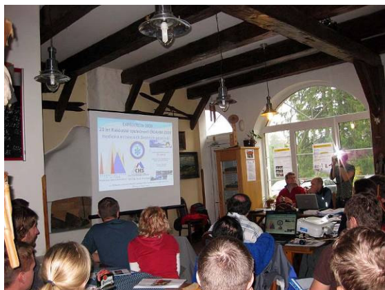
Obr. č. 8: Zaplněný sál při přednáškách