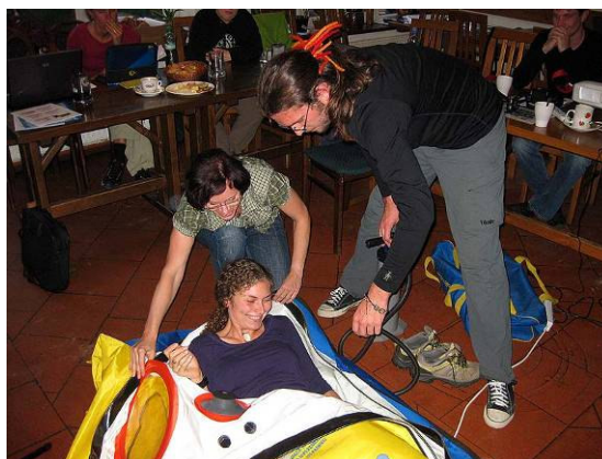
Obr. č. 9: Ukázka z workshopu „přenosná přetlaková komora“