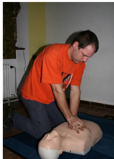
Obr. č. 2: Improvizovaná sedačka z lana a snášení zraněného v horském terénu Obr. č. 3: Nácvik resuscitace na modelu