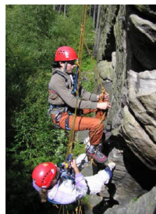
Obr. č. 6, 7: Kurz skalní záchrany, nácvik záchranných lanových technik - zpočátku bezpečně na zemi, po získání základních dovedností i ve skalní stěně