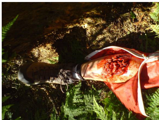
Obr. č. 1: „Reálně“ vypadající poranění - simulovaná otevřená zlomenina bérce při praktických nácvicích ošetření v rámci kurzů první pomoci