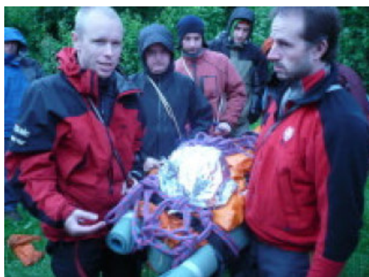
Obr. č. 4, 5: Improvizovaná nosítka z lana a transport těžce zraněného pacienta